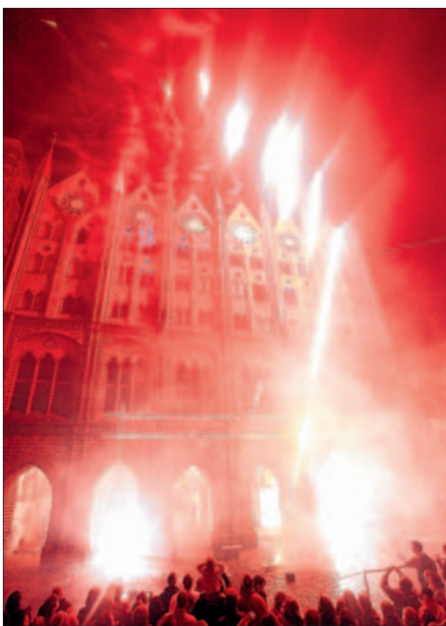
Rathaus in Flammen. Das Barockfeuerwerk am Samstagabend lässt die Zuschauer nicht aus dem Staunen herauskommen.

Kaum ist mit dem großen Umzug am Freitagabend der erste Höhepunkt Geschichte, setzt