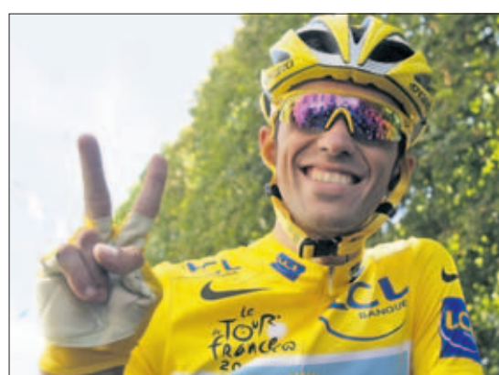
Zum zweiten Mal Tour-Sieger: der 26-jährige Spanier Alberto Contador aus dem Astana-Team.

Der Spanier Alberto Contador hat mit einer beispiellosen Energieleistung die Tour de France gewonnen. Beim Finale in Paris hatte er gestern einen Vorsprung von 4,11 Minuten vor dem Zweitplatzierten Andy Schleck aus Luxemburg. Lance Armstrong feierte mit Platz 3 ein starkes Comeback. Seite 2: Kommentar Berichte im Sportteil