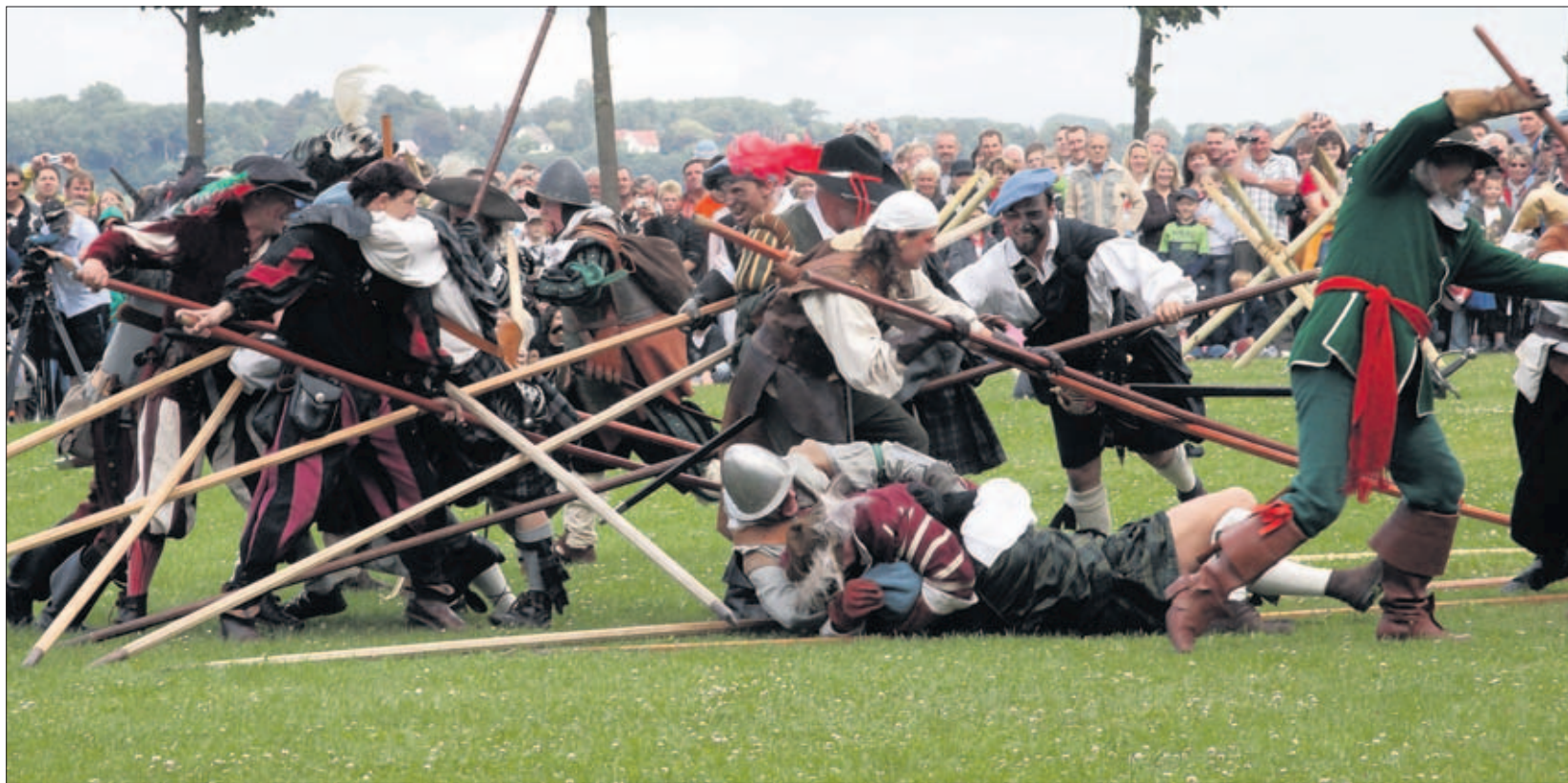
Bericht im Lokalteil

Lanzen knallen, Söldner der „Kaiserlichen“ und des schwedischen Königs wälzen sich auf dem Boden. Kampfszenen wie diese gab es bei den Wallensteintagen in Stralsund am Wochenende reichlich zu sehen. Das Volksfest zog mehr als 40 000 Besucher in die Altstadt, wo an den Stralsunder Triumph gegen den hochmütigen Feldherren Wallenstein erinnert wurde. Doch auch ein Pestzug ließ die finsternen Zeiten des Dreißigjährigen Krieges wieder aufleben. Einen glanzvollen Abschlusspunkt am Sonnabend setzte ein Barockfeuerwerk, das das Rathaus in rot und weiß leuchtenden Farben „in Flammen“ setzte. Die Wallensteintage waren zugleich Auftakt für die Feiern zum 775-jährigen Jubiläum der Hansestadt.