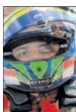
Der verletzte Felipe Massa

Ferrari-Pilot Felipe Massa wird trotz seines Horror-Crashes auf dem Hungaroring keine bleibenden Schäden davontragen. Die Ärzte gaben gestern Entwarnung. Den Großen Preis von Ungarn gewann Formel-1-Weltmeister Lewis Hamilton. Seite 2: Presseschau