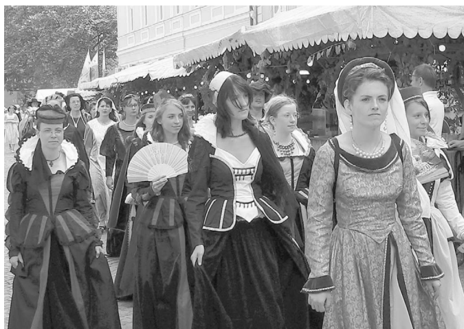
Alle Teilnehmerinnen und Teilnehmer des historischen Festumzuges am Freitag voriger Woche gaben sich große Mühe, den Zuschauern zu gefallen, was ihnen mit viel Beifall an den Straßenträndern gedankt worden ist.