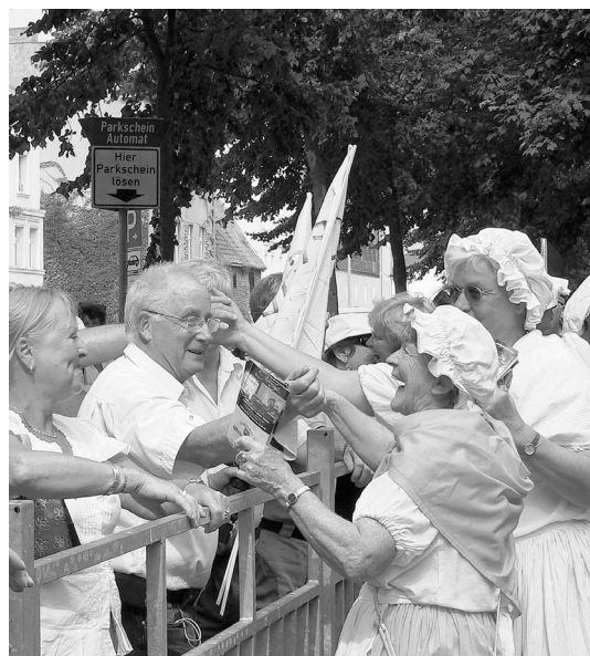
Eine Überraschung für den Strela-Frauenchor: der schwedische Fanclub aus Malmö begrüßte die Damen an der Gerhart-Hauptmann-Schule mit einem Transparent.