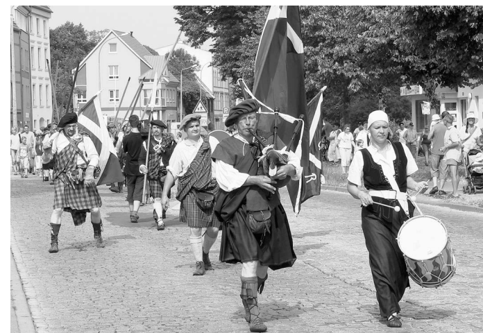
Extra aus dem Voigtland nach Stralsund reiste das schottische Regiment „MacKays Regiment of Foote“, unter ihnen auch ein Stralsunder. Die 30 Mitwirkenden waren auch beim Festumzug dabei.