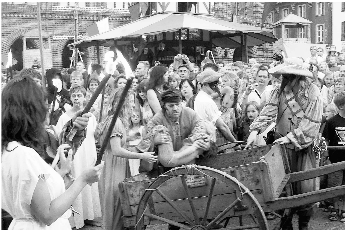
Eine gelungene Premiere erlebten die Zuschauer mit dem Pestumzug, hier eine Szene auf dem Alten Markt.