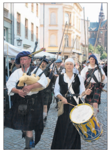
Der Festumzug bahnt sich den Weg durch die von Zuschauern gesäumte Mönchstraße.

Stralsund. Kurz nach drei Uhr am Nachmittag waren die ersten der gut 200 Kostüme schon angezogen. Ratsherren, Marktfrauen, Landsknechte, Bürgerfrauen und viele mehr machten sich wie in je-